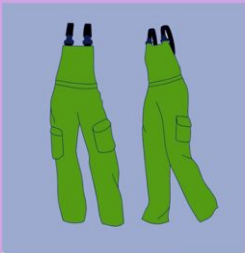
The Section for Experimental Biomedicine