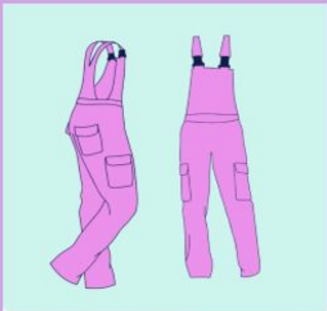
Sjuksköterskesektionen Linköping Sjuksköterska