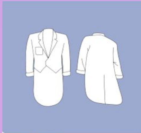
Medicinska Föreningen Läkarutbildningen